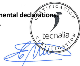
Carlos Nazabal Alsua Manager

Issued date / Fecha de emisión: 22/07/2024 Update date / Fecha de actualización: 22/07/2024 Valid until / Válido hasta: 19/07/2029 Serial N° / N° Serie: EPD1061100-E