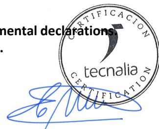
Carlos Nazabal Alsua Manager

Issued date / Fecha de emisión: 22/07/2024 Update date / Fecha de actualización: 22/07/2024 Valid until / Válido hasta: 19/07/2029 Serial Nº / Nº Serie: EPD1060500-E