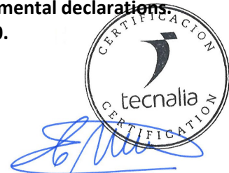
Carlos Nazabal Alsua Manager

Issued date / Fecha de emisión: 22/07/2024 Update date / Fecha de actualización: 22/07/2024 Valid until / Válido hasta: 19/07/2029 Serial Nº / Nº Serie: EPD1060100-E